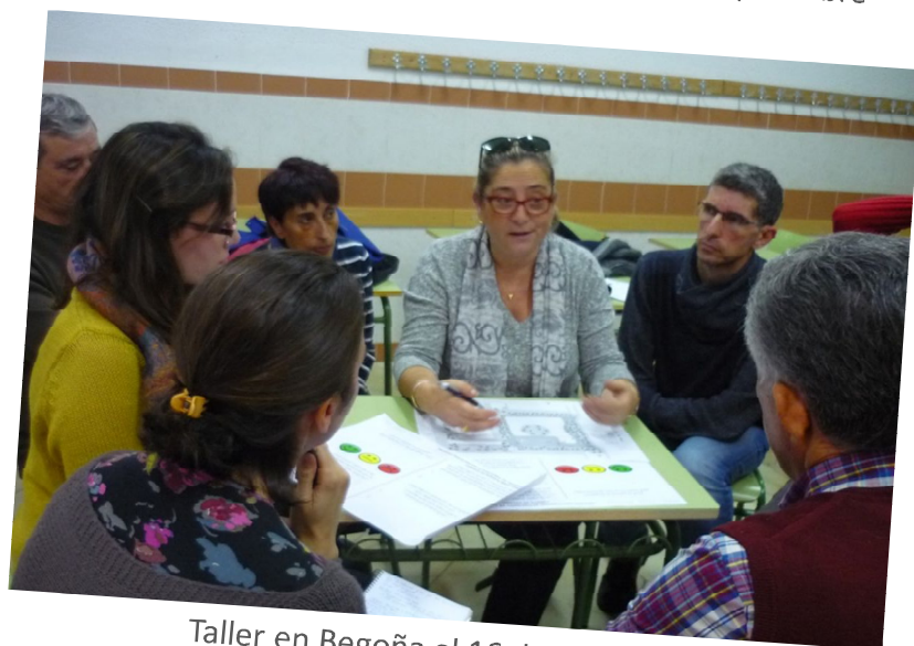
Taller en Begoña el 16 de diciembre