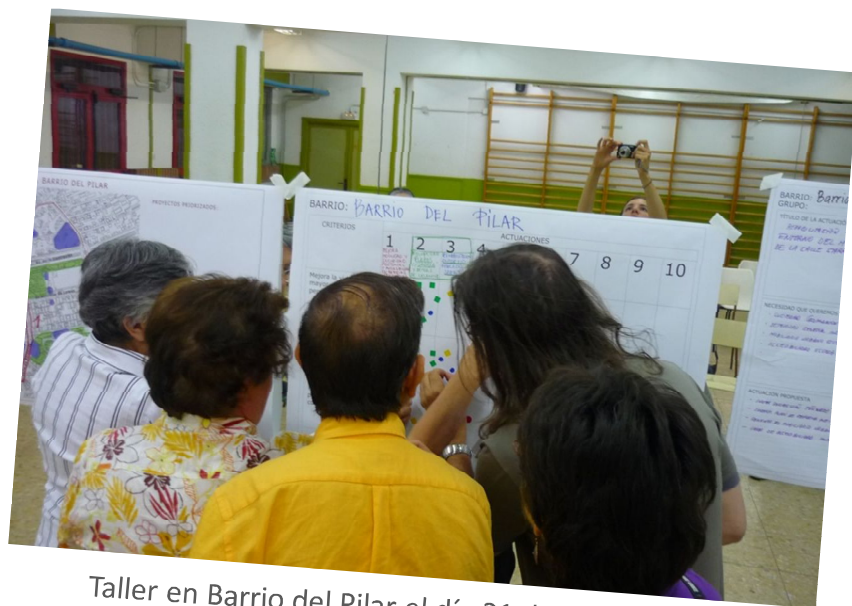
Taller en Barrio del Pilar el día 21 de septiembre