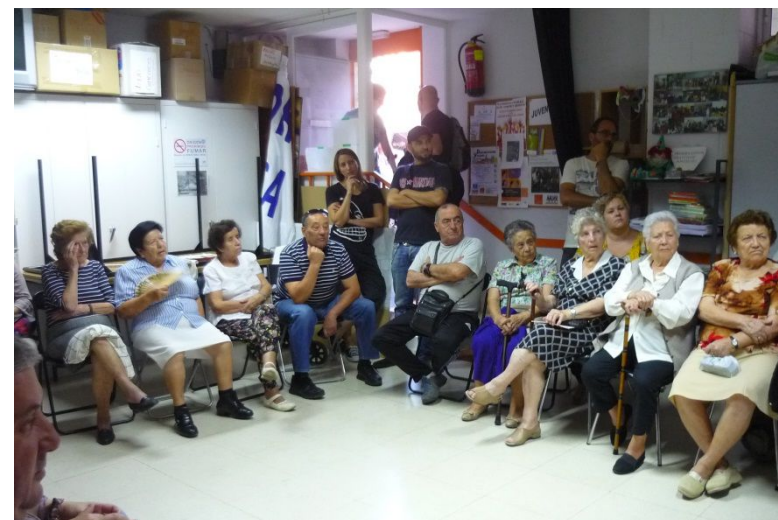
Taller en Poblados A y B el día 27 de septiembre