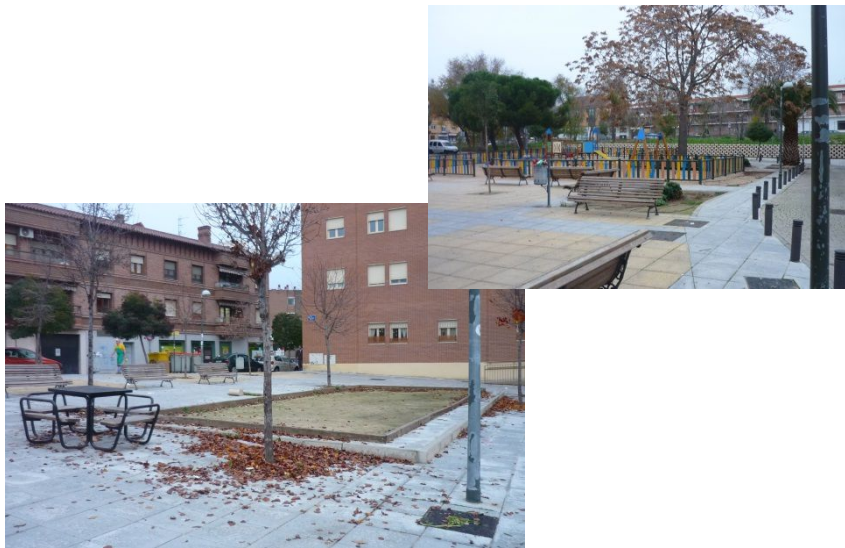
POBLADOS A Y B

Proyectos de rehabilitación de áreas consolidadas renaturalizando los espacios y adaptándolos para el uso de niños, mayores y jóvenes