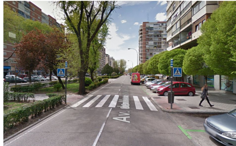
BARRIO DEL PILAR

Mejora de la accesibilidad y seguridad peatonal con la construcción de semáforos, enchanche de aceras, nuevos pavimentos en cruces, etc. Con especial atención en centros educativos