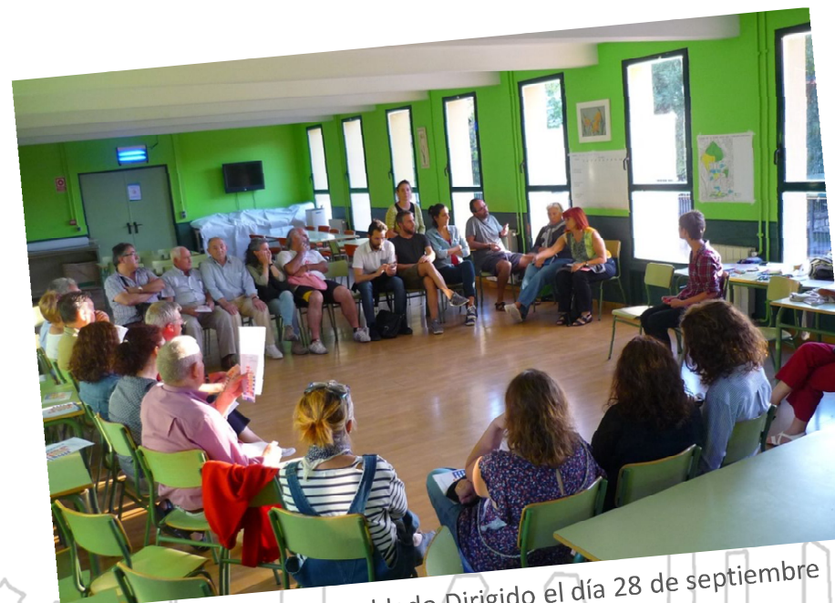
Taller en Poblado Dirigido el día 28 de septiembre