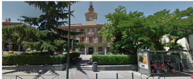
PUEBLO DE FUENCARRAL