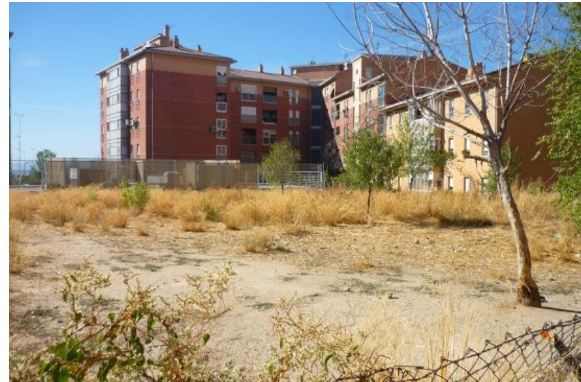
POBLADOS A Y B

Proyecto de plaza con área infantil, pista deportiva, área estancia y circuito biosaludable en solar céntrico en el barrio