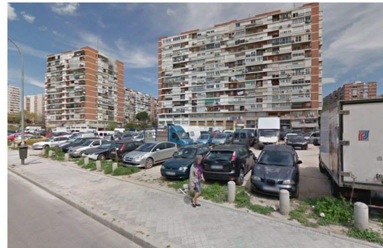
Bº DEL PILAR

Proyecto de construcción de una nueva plaza ajardinada con áreas infantiles y estanciales y un espacio de aparcamiento en un solar con aparcamiento informal.