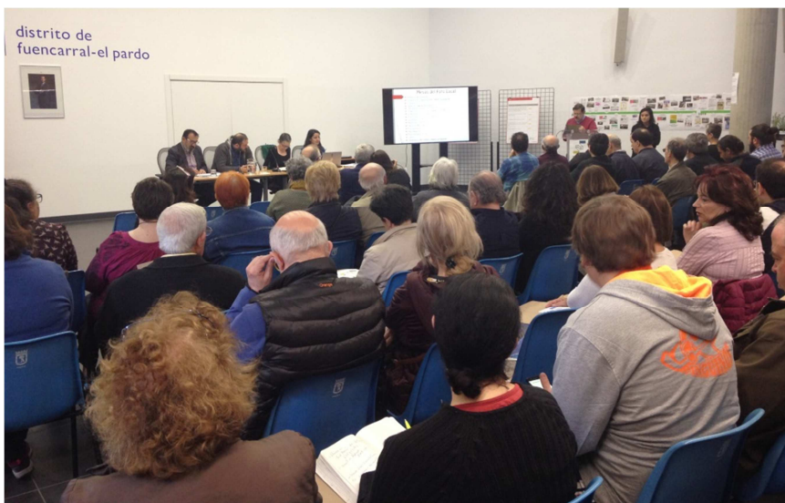
Plenario de Fuencarral-El Pardo marzo 2019

El sentido de pertenencia también tiene que ver con conocer qué se hace en el territorio, tener una visión más amplia de todas las entidades, grupos, asociaciones que existen y que trabajan por determinados aspectos de la comunidad. Conocerse y entablar relaciones de apoyo. En este sentido los Plenarios de Foro han servido desde su creación para conectar a las vecinas y vecinos, fomentar un espacio propositivo y un tiempo de reunión y de escucha no institucional, libre y sin juicios. En los Plenarios del Foro Local de Fuencarral han ido una media de 80 personas que a lo largo de estos tres años se han visto una, dos y hasta tres veces al año para trabajar juntas, charlar y consensuar qué es lo mejor para el distrito.