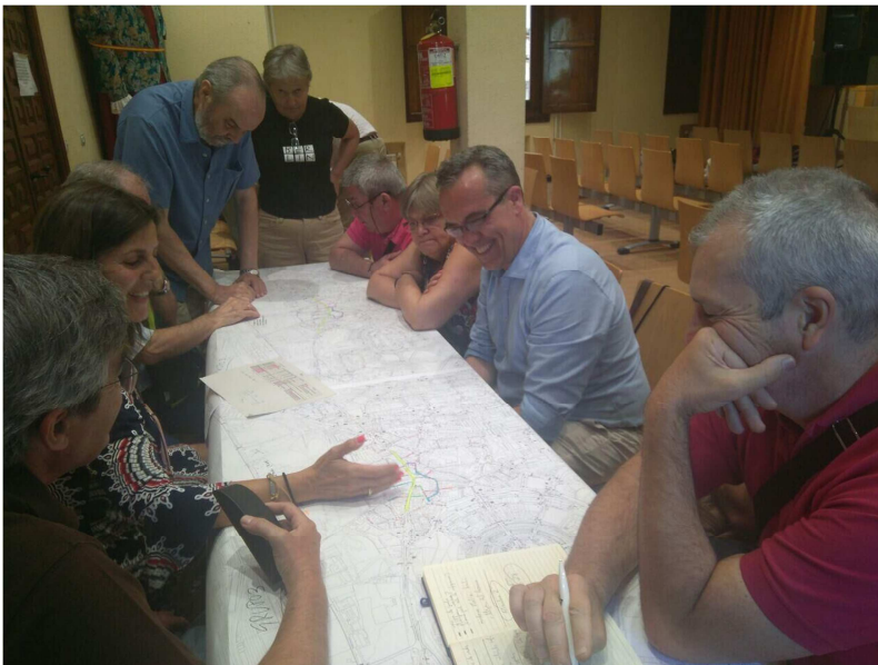
Talleres Proyecto Movilidad y accesibilidad para Nuestra Señora de Valverde. Mayo 2017

Los Presupuestos Participativos o los Fondos de Reequilibrio Territorial han servido, entre otras cosas, a hacer más accesible la información sobre lo que cuestan las acciones, obras urbanas o proyectos sociales que se pueden llevar a cabo en la ciudad. En el proceso participativo de la Mejora de Movilidad de Nuestra Señora de Valverde la presencia de cuatro funcionarias técnicas del Área fue muy enriquecedor para las personas que participaron en los talleres, ya que pudieron preguntar y entender mejor las fases de un proyecto de tal envergadura.