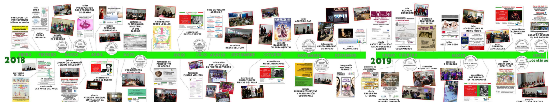
Línea del tiempo. Actividades organizadas por las Mesas del Foro 2018-2019

Participante en la Mesa de Igualdad y LGTBI.