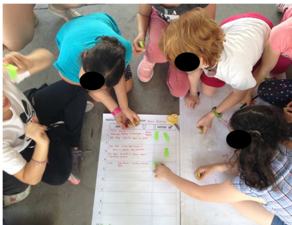
Talleres Patios Inclusivos. Mayo 2018

Para los Fondos de Reequilibrio Territorial se visitaron en varias ocasiones los siete barrios, reuniendo a vecinas y vecinos de cada uno. El objetivo era realizar un diagnóstico y elaborar una propuesta conjunta. El hecho de poder proponer obras de mejora urbana desde el conocimiento vivencial fomenta el sentido de pertenencia al barrio y una mejor convivencia.