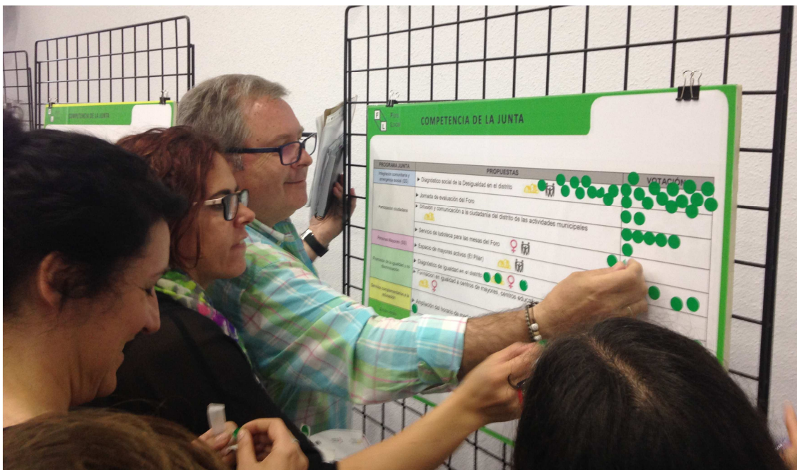
Plenario Foro Local. Junio 2018

Un ejemplo de este acompañamiento ha sido con la Mesa de Mayores del Foro Local, la cual ha contado con el apoyo de una persona técnica para su funcionamiento. Este acompañamiento se concretó tras valorar tanto la propia Mesa como la persona técnica, aquellos aspectos en los que podría ser más útil su trabajo, traducéndose en apoyar en la preparación de las reuniones de Mesa, normas de funcionamiento, redacción de actas, convocatorias y otras tareas de secretaría. Además, se ha acompañado en la puesta en marcha estrategias tanto para la planificación y evaluación de las acciones de la Mesa como fórmulas para atraer a más personas participantes a ella. Se han buscado colaboraciones con recursos del distrito para la realización de actividades que respondían a los objetivos planteados desde la Mesa, como fue la charla “Sexualidad y Mayores” llevada a cabo por el Espacio de Igualdad Lucrecia Pérez, que no sólo ayudó a trabajar y reflexionar conjuntamente este ámbito de la vida de las personas mayores, sino que sirvió para dar a conocer el trabajo de la Mesa a otras personas y promover su participación, (sobre todo mujeres, ya que su presencia en la mesa es baja, alrededor del 17%) y a que la propia Mesa conociera otros recursos de su distrito que no trabajan específicamente con personas mayores. Todo el trabajo de acompañamiento ha tenido como objetivo dotar de ideas y herramientas para mejorar su funcionamiento y que la Mesa trabajara de forma autónoma.