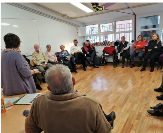
Charla Amor y Sexualidad en las personas mayores. Mesa de mayores. Enero 2019

Un ejemplo de este acompañamiento ha sido con la Mesa de Mayores del Foro Local, la cual ha contado con el apoyo de una persona técnica para su funcionamiento. Este acompañamiento se concretó tras valorar tanto la propia Mesa como la persona técnica, aquellos aspectos en los que podría ser más útil su trabajo, traducéndose en apoyar en la preparación de las reuniones de Mesa, normas de funcionamiento, redacción de actas, convocatorias y otras tareas de secretaría. Además, se ha acompañado en la puesta en marcha estrategias tanto para la planificación y evaluación de las acciones de la Mesa como fórmulas para atraer a más personas participantes a ella. Se han buscado colaboraciones con recursos del distrito para la realización de actividades que respondían a los objetivos planteados desde la Mesa, como fue la charla “Sexualidad y Mayores” llevada a cabo por el Espacio de Igualdad Lucrecia Pérez, que no sólo ayudó a trabajar y reflexionar conjuntamente este ámbito de la vida de las personas mayores, sino que sirvió para dar a conocer el trabajo de la Mesa a otras personas y promover su participación, (sobre todo mujeres, ya que su presencia en la mesa es baja, alrededor del 17%) y a que la propia Mesa conociera otros recursos de su distrito que no trabajan específicamente con personas mayores. Todo el trabajo de acompañamiento ha tenido como objetivo dotar de ideas y herramientas para mejorar su funcionamiento y que la Mesa trabajara de forma autónoma.