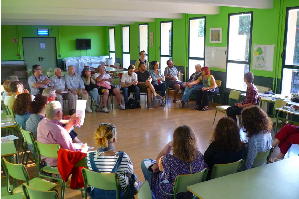
Talleres FRT. Poblado Dirigido. Septiembre 2016

“Mejorar el diálogo y los canales de comunicación entre los técnicos y las asociaciones”