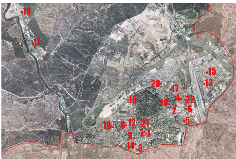
MAPA DE ESPACIOS DE PARTICIPACIÓN

Con el objetivo de avanzar hacia modelos más eficientes, mejorar los procesos y aumentar el impacto de los mismos, es necesario conocer y profundizar en la visión y satisfacción de la ciudadanía con los mismos.