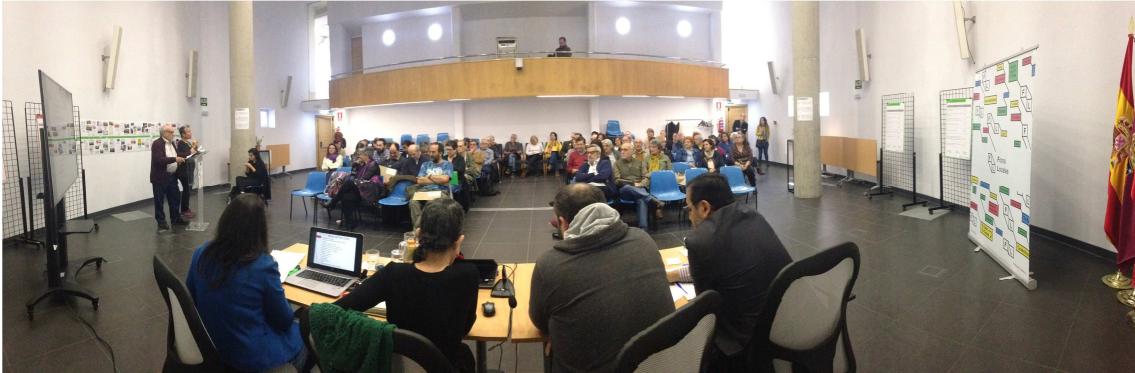
Plenario Foro Local. Marzo 2019

"Con el nacimiento de todos los procesos de participación la Junta se ha transparentado más, por la petición por parte de la ciudadanía de informes, memorias, (...)"