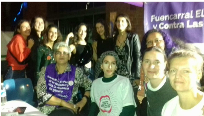
Punto Violeta. Fiestas del Pilar.

Por otro lado, se comenta que el Foro Local si bien ha pretendido aumentar la participación, no ha constituido el único camino para hacerlo. En ocasiones la participación en algunos procesos, como por ejemplo de mejora de la convivencia vecinal, ha ido más allá de las vías institucionales posibilitando que personas reacias a estos espacios por considerarlos institucionales se involucraran en procesos e iniciativas que han surgido de las propias mesas del Foro. Éste ha sido el caso de la Mesa de igualdad y los Puntos Violetas. No todas las mujeres que participan voluntariamente en los Puntos Violetas son de la Mesa, pero gracias a la organización de éstos la red se ha creado y cada vez es más fuerte, de manera que la información fluye entre todas, gracias también a otros espacios como el Café Feminista. La organización de actividades durante todo el año mantiene la comunicación y el vínculo.